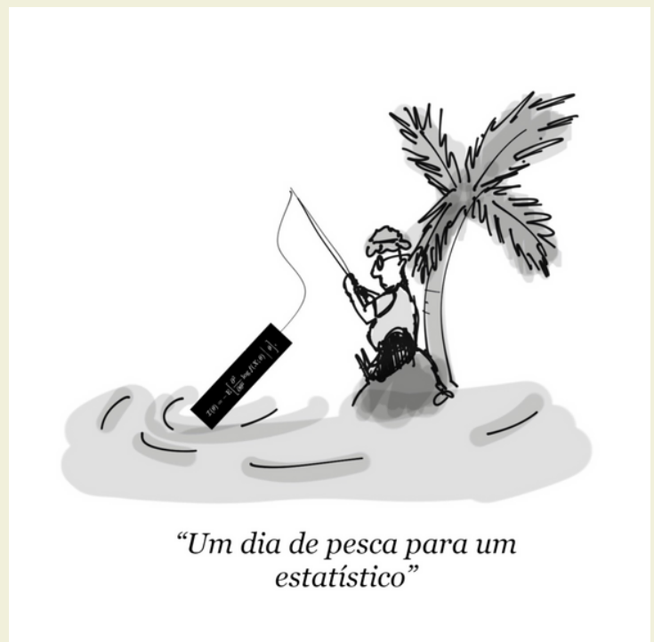
“Um dia de pesca para um estatístico” Estatístico pescando um Fisher