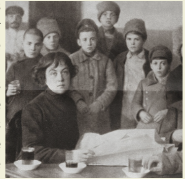
Alexandra Kollontai (esq.)

mais claro ficava para elas que ele é seu defensor verdadeiro, que a classe trabalhadora também luta por elas, pelas dolorosas necessidades puramente femininas. As próprias trabalhadoras, organizadas e conscientes, dedicaram-se muito à elucidação dessa tarefa.